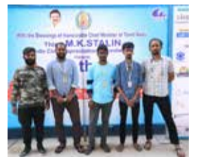
20th CIFF's PRINT UNIT