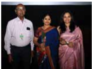
With the team of HADINELENTU