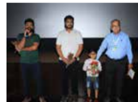
With the team of O2