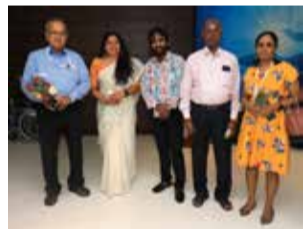
With the team of TAYA