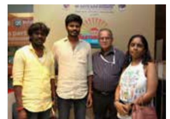
With the Team of the Tamil film BUFFOON