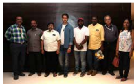
With the Team of the Tamil movie POTHANUR POST OFFICE