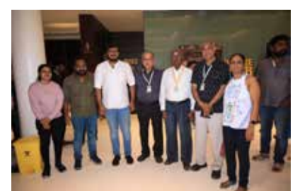
With the Team of the Malayalam movie SAUDI VELLAKKA CC.225/2009