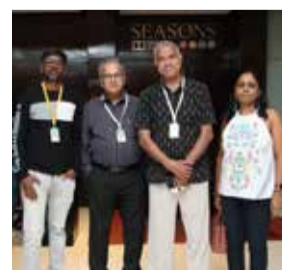
With the Team of the Tamil film AADHAAR