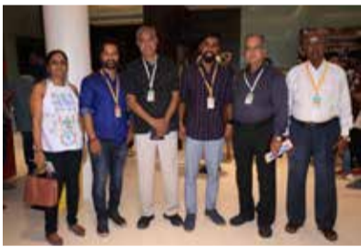
With the Team of the Assamese film SOUL OF SILENCE

Seating for all shows will be on first come first served basis