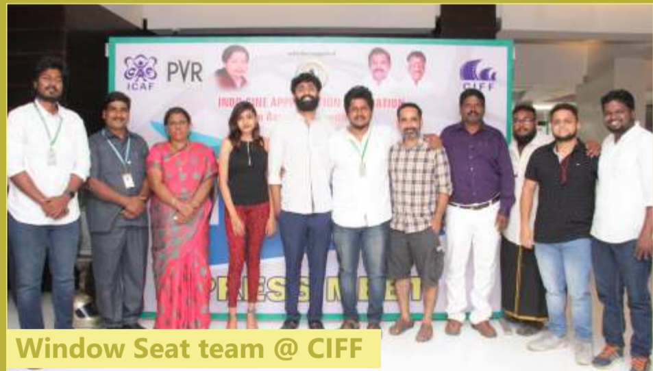
Window Seat team @ CIFF