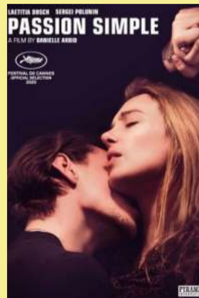
Simple Passion PVR – Santham at 10 am