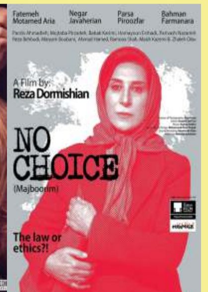
No Choice PVR – Santham at 12.30