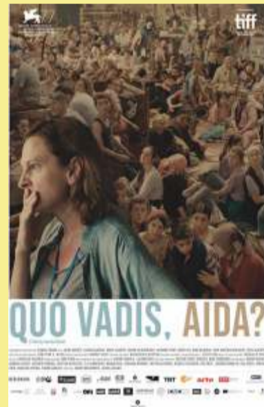
Quo Vadias, Aida? PVR – Seasons at 10 am