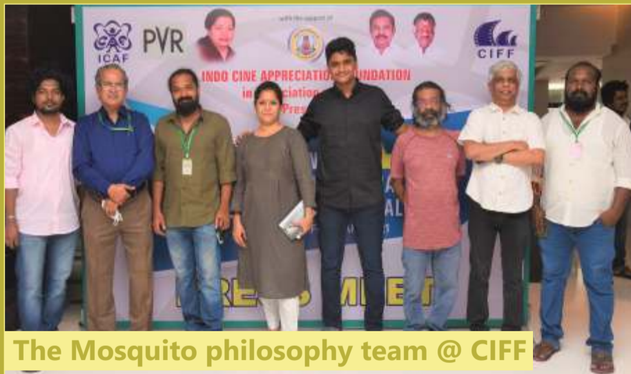
The Mosquito philosophy team @ CIFF