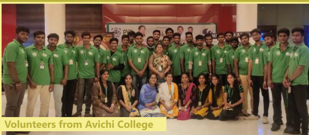
Volunteers from Avichi College