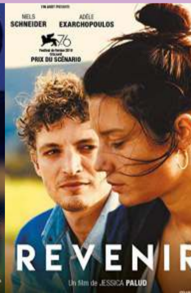
Revenir 3 pm at PVR - Serene