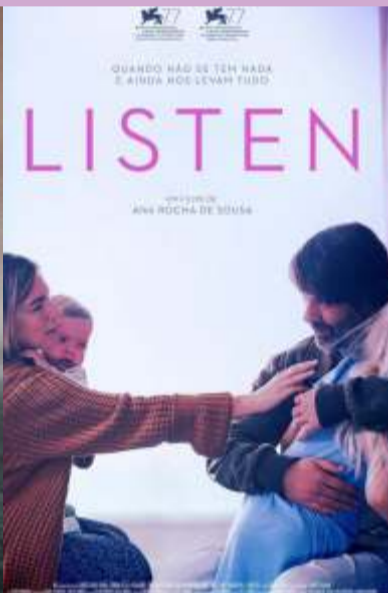
Listen 9.30 am at PVR - 6 Degrees