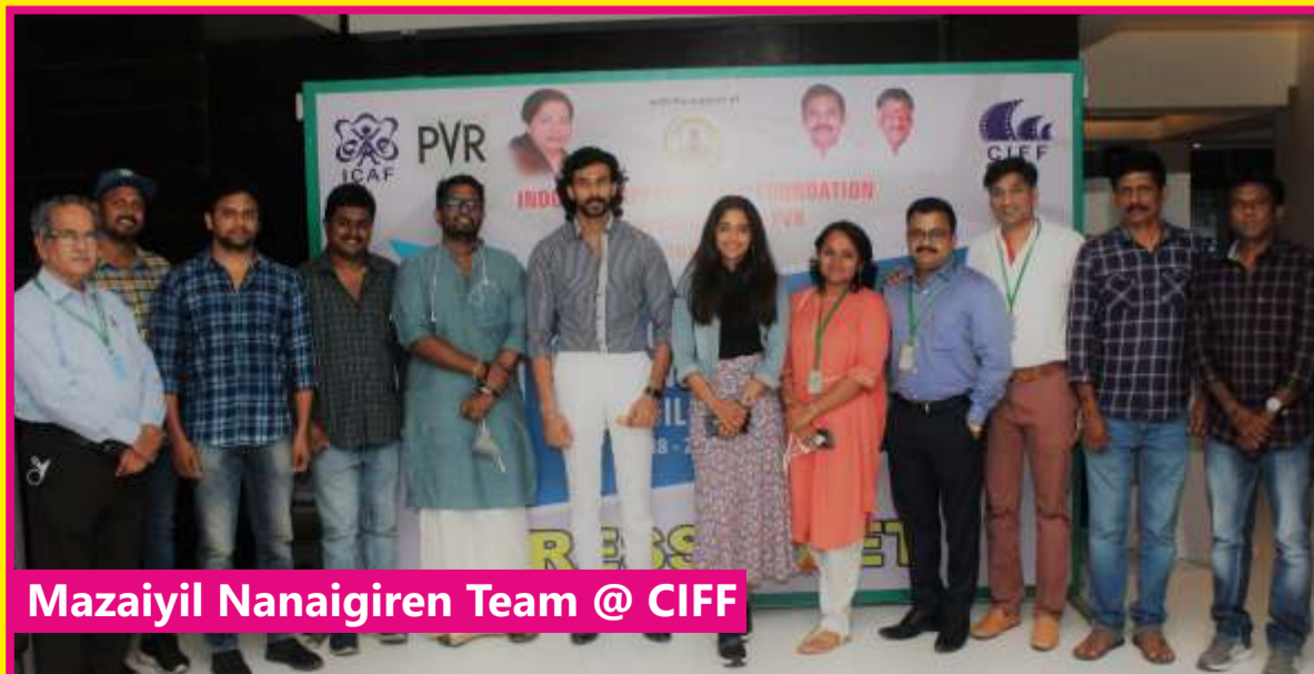
Mazaiyil Nanaigiren Team @ CIFF