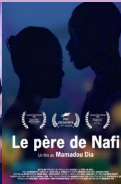
Nafi's Father 6.15 pm at PVR - Serene