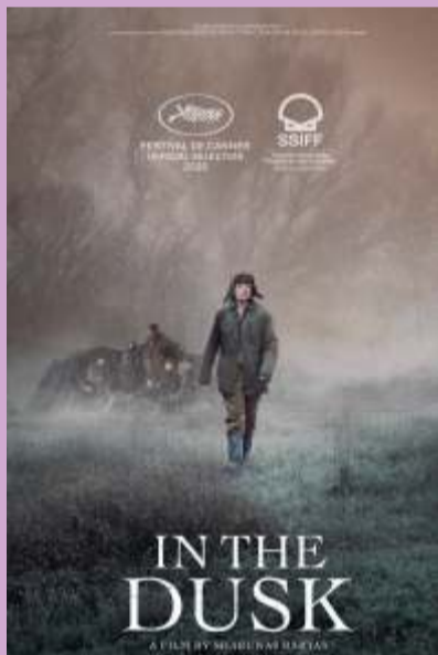
In the Dusk 10 am at SDC Anna Cinemas