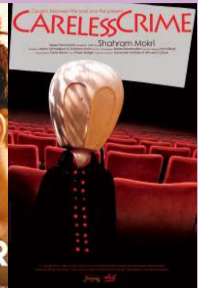
Careless Crime 3.30 pm at PVR - Santham