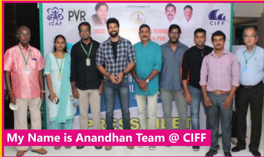
My Name is Anandhan Team @ CIFF