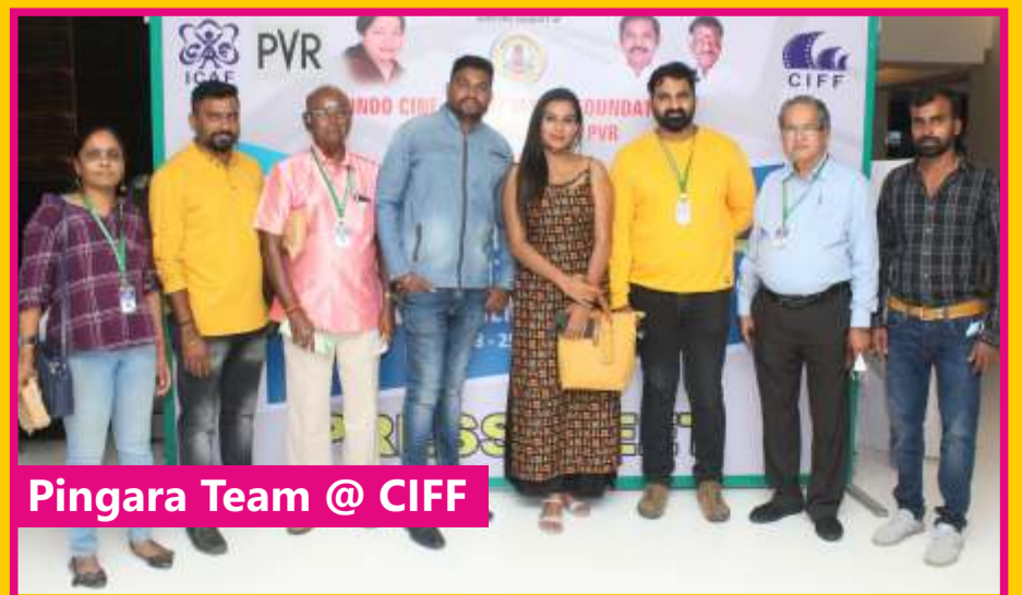
Pingara Team @ CIFF