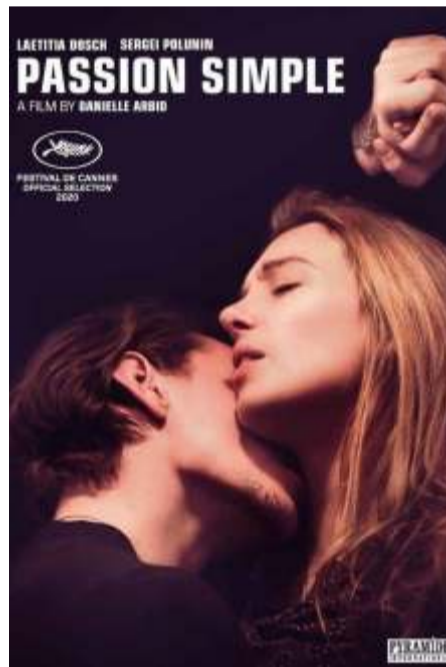
Simple Passion PVR Seasons – 10 am 1 nomination at San Sebastián International Film Festival 2020