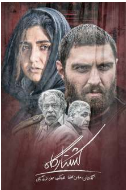
The Slaughterhouse SDC Anna Cinemas – 3 pm 1 win at Busan International Film Festival 2021