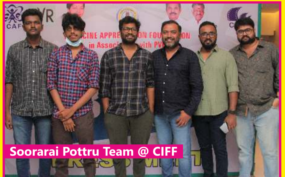
Soorai Pottru Team @ CIFF