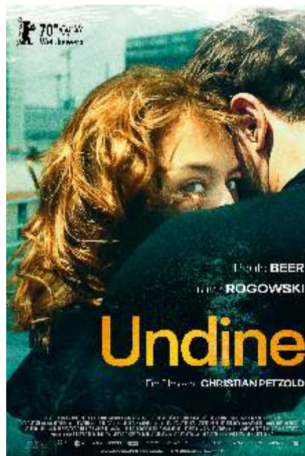
Undine @PVR Santham – 3.30 pm 3 wins at Berlin International Film Festival 2020