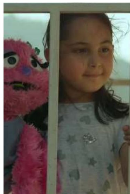
That Night's Train @PVR Serene – 3 pm