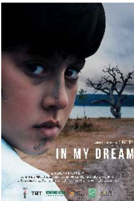
In My Dream PVR Six Degrees – 1 pm 2 wins & 6 nominations