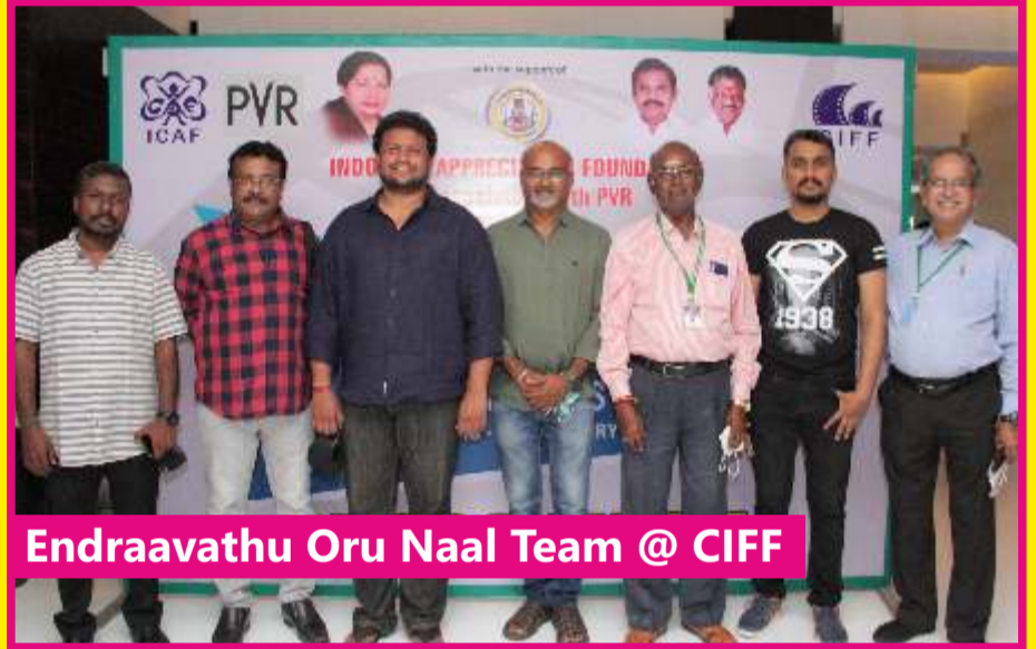
Endraavathu Oru Naal Team @ CIFF