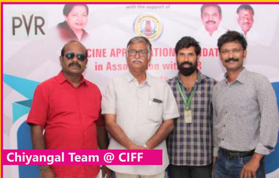
Chiyangal Team @ CIFF