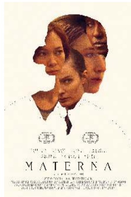
Materna PVR Serene – 1 pm 2 wins & 5 nominations at Tribeca Film Festival 2020