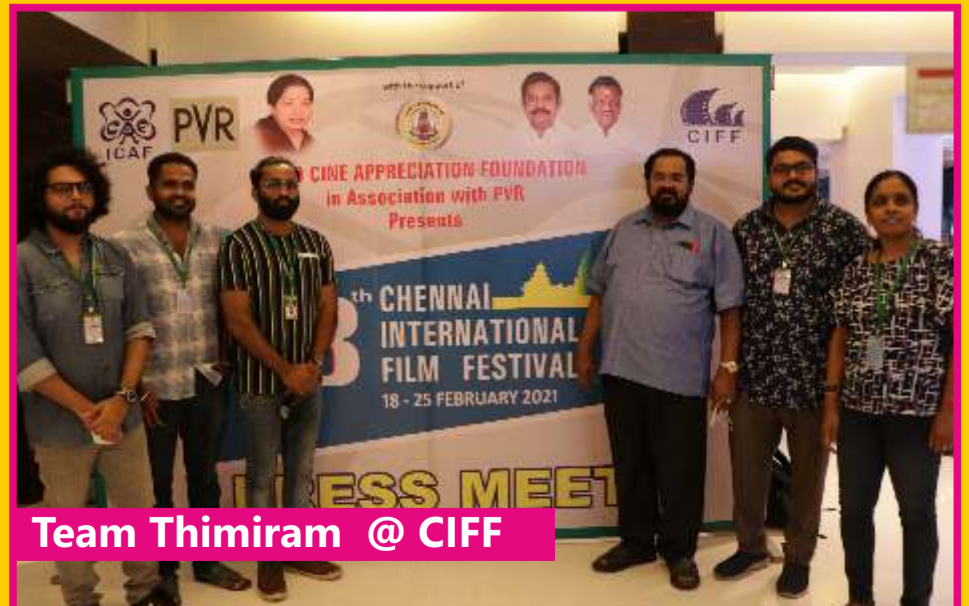
Team Thimiram @ CIFF