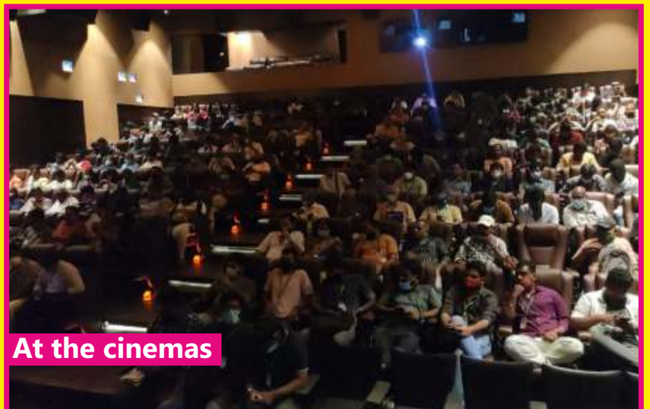
At the cinemas