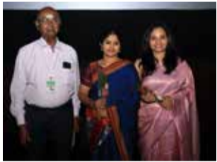
With the team of HADINELENTU