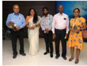
With the team of TAYA