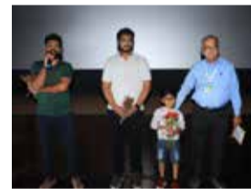
With the team of O2