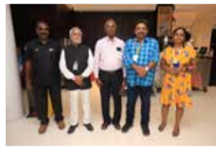
With the team of MAAMANITHAN