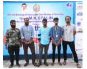
20th CIFF's PRINT UNIT