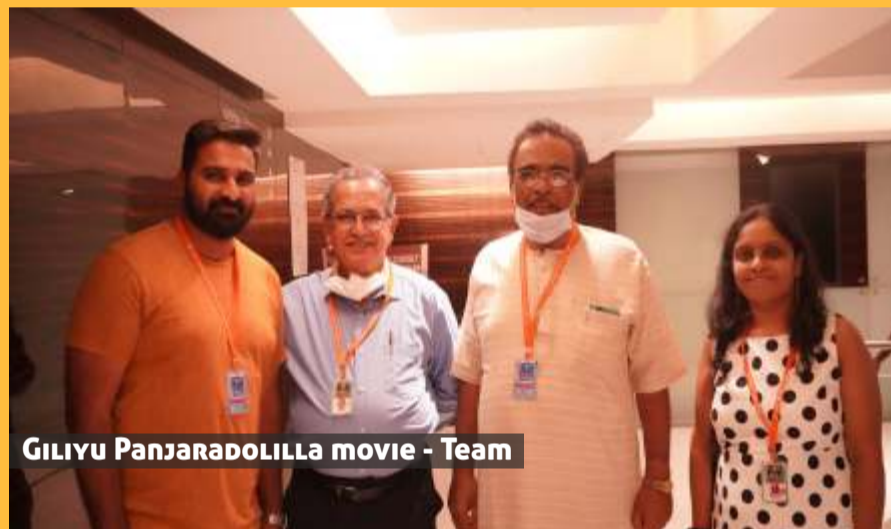
GILYU PANJARADOLILLA movie - Team