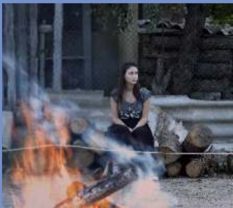
Women Do CRY 10.15 am at Santham