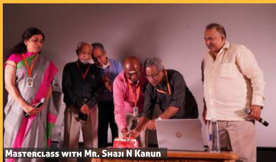
Masterclass with Mr. Shaji N Karun