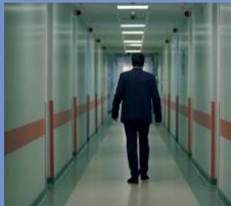
5 MINUTES TOO LATE 10 am at Anna Cinemas