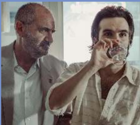
THE REPLACEMENT 12.30 pm at Seasons screen