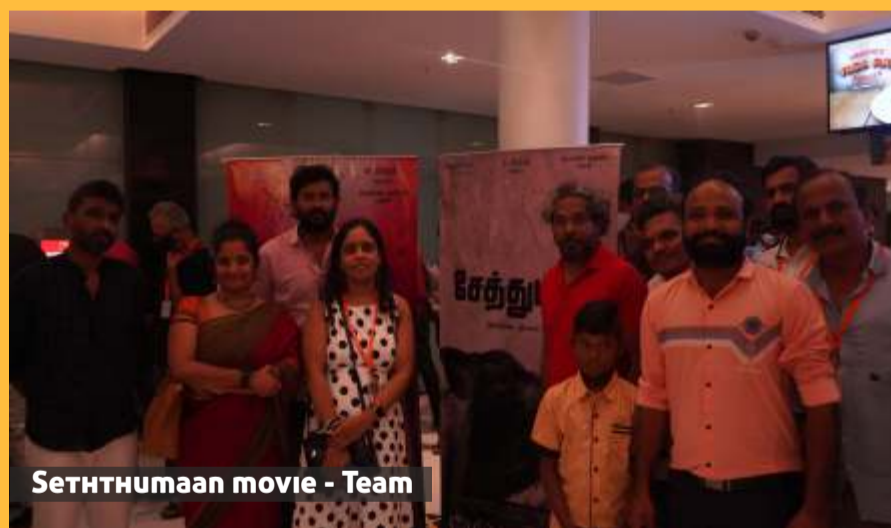
SETTHUMAN movie - Team