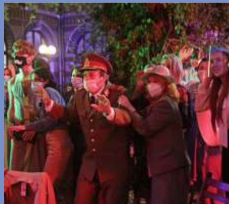
BAD LUCK BANGING OR LOONY PORN 6.30 pm at Santham screen